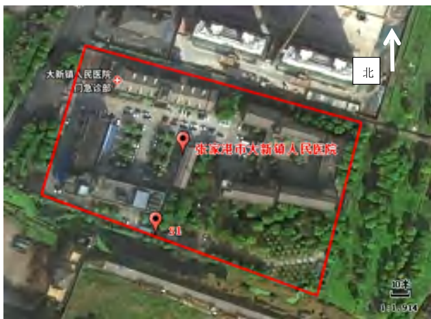
图 7-1 废水监测点位图